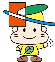
「清田区マスコットキャラクター きよっち」

・清田区民センター運営委員会（清田1条2丁目） 電話 883-2050（受付時間 土日も含む9時～16時30時）