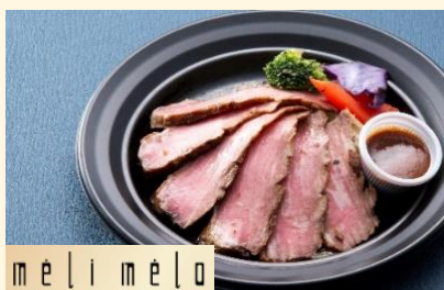
m e | i m e | o