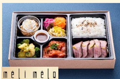
m e | i m e | o