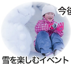
雪を楽しむイベント

今後は、これまでの意見交換を踏まえて実験的な取組を行っていく予定です。 取組の具体的な内容は引き続き地域の方々と一緒に検討していきます。