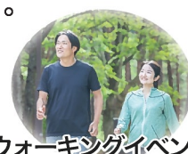
ウォーキングイベント