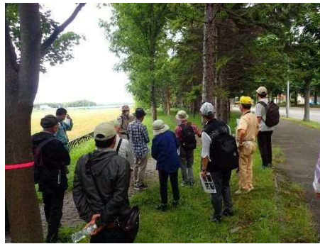
ミニツアー（約2時間30分）