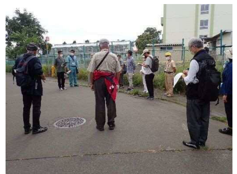
現地解散となります。