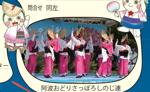
阿波おどりさっぽろしのじ連

日時 7月25日(土) 11:00~17:00 場所 北海道医療大学 あいの里キャンパス駐車場 (あいの里2-5) 問合せ 拓北・あいの里まちづくりセンター (Tel778-2355) ※雨天決行