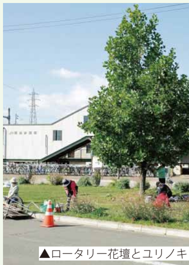
▲ロータリー花壇とユリノキ

「今後の目標を教えてください！」 駅に降りた方を、多彩な花が咲くロータリーから百合が原公園へ道なりに導く「フラワーロード」。そんなすてきな道を作ることが、私たちの夢です。そのためにも、もっと多くの仲間が必要です。花が好きな気持ちさえあれば、初心者でも大歓迎です。ぜひ一緒に活動しましょう！