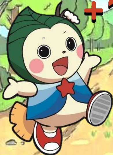
▲北区まちづくりキャラクターぽっぴい