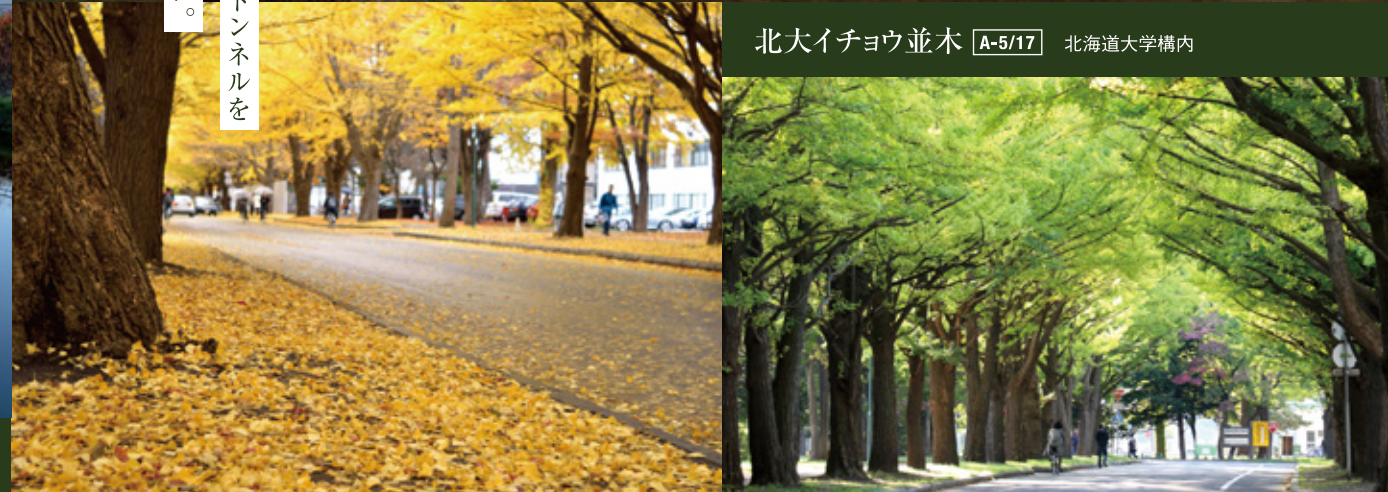
北大イチョウ並木 A-5/17 北海道大学構内