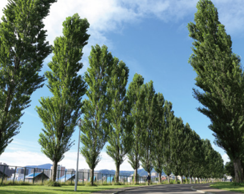
北大ポプラ並木・平成ポプラ並木 A-5/15 北海道大学構内