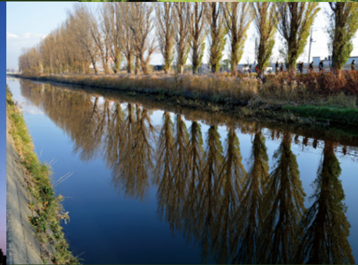
創成川通りのポプラ並木 D-3/61 太平、屯田1条1丁目～