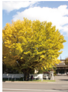
龍雲寺前 E-3/78 篠路5条10丁目

篠路の入植者たちの心のよりどころだった寺に、新天地開発の記念に植栽したと伝えられるイチョウは推定樹齢100年以上。北区唯一の北海道自然環境等保全条例指定の保存樹。