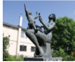
▲「いのち」坂坦道 幼児の交通死亡事故から 交通安全の願いを込めて