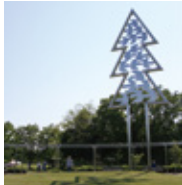
▲「北の森たち」伊藤隆一

札幌駅周辺、緑地、公園などに点在する野外彫刻の数々。 誰もが気軽に芸術と触れ合うことができるパブリックアートと記念撮影をしてみたい。