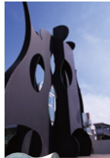
「デアイバチ」 流政之▶ “市民の待ち 合わせの場に” との願いを込めて