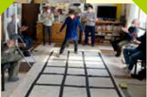
▲上写真：ピリカサロン「パソコンお悩み相談」の様子 下写真：ピリカサロン「ふまねっと」の様子