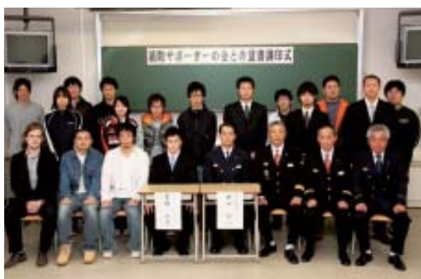
消防サポーターの会と北消防署との覚書調印式

私は消防団に入団して、いくつかの活動に参加してきました。その中でも最も必要性を感じた活動として普通救命講習というものがありました。