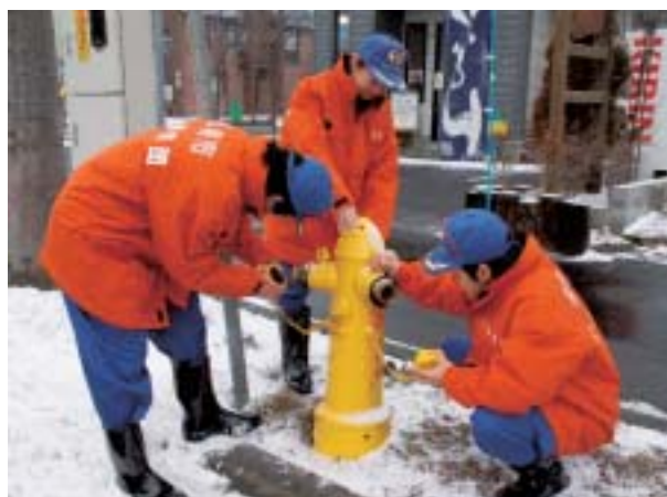
消火栓の点検作業

また、もし消防士にならなかったとしても消防団での活動はとても貴重な社会体験であり、また、ふつうでは経験できないようなことをすることが