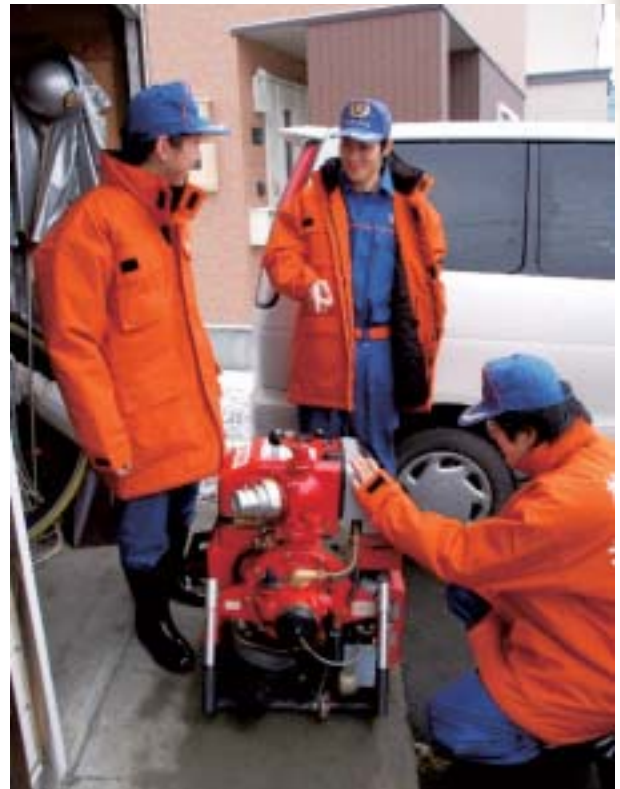
放水ポンプの点検作業