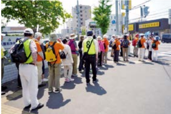
青空の下、元気に歩く参加者のみなさん

今年で9回目を迎える札幌市主催の市民交流ウォーキング大会が平成28年5月23日（月）に開催されました。今年は北区が担当区として「北区健康づくり協議会」の協力を得て実施し、新琴似安春川河畔から屯田防風林を4km・8kmの2コースに分かれ、約300名が参加されました。当日は晴れ渡る空の下、100名程のボランティアさんのご協力もあり、大きな事故もなく、楽しく歩き皆さんゴールすることができました。