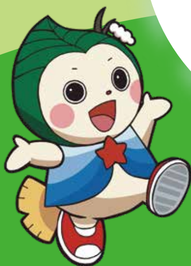
北区まちづくり キャラクター 「ぽっぴい」