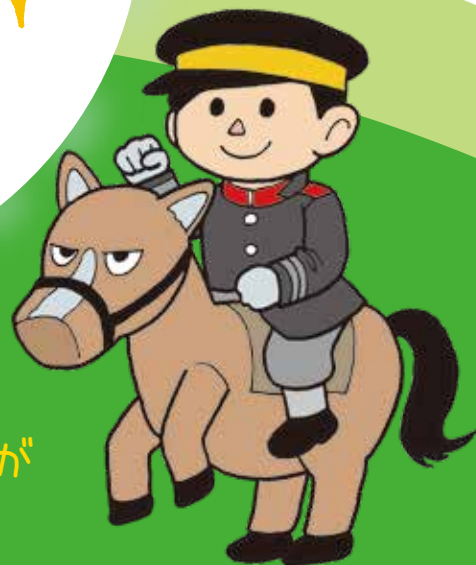
屯田連合町内会 公認キャラクター 「屯田兵さん」

あなたからのメッセージが とん でん まち 屯田の街を げん き さらに元気にします