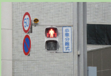
えきまえこうさてん 駅前交差点

ちゅうしゃじょう 駐車がはっきりし ほこうしゃ じゃま ていて、歩行者の邪魔 にならない