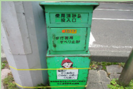
えきまえ こうさてん 駅前の交差点