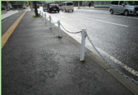
さっぽろえきまえ 札幌駅前