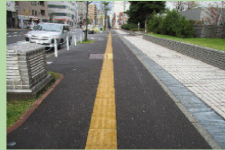
さっぽろえきまえ 札幌駅前

みち ひろ てんじ 道が広く、点字ブロッ クもあり、多くの人が つか 使いやすくなっている