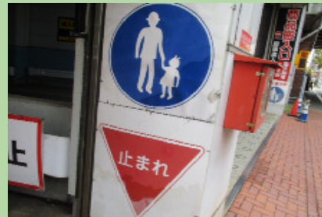
ちゅうしゃじょう ヨドバシカメラの駐車場