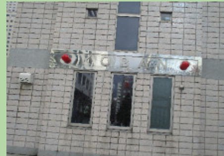
さっぽろえきまえ こうばん 札幌駅前の交番

みち ひろ てんじ 道が広く、点字ブロッ クもあり、多くの人が つか 使いやすくなっている