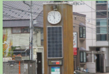
ほっかいどうしんようきんこふきん 北海道信用金庫付近