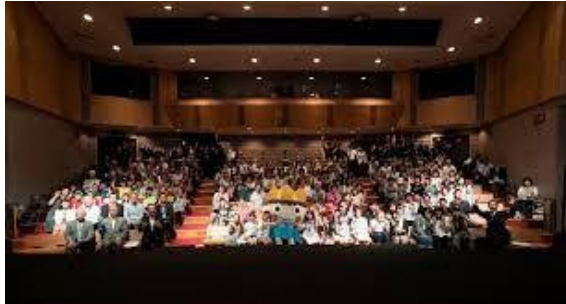
こどもの劇場やまびこ座