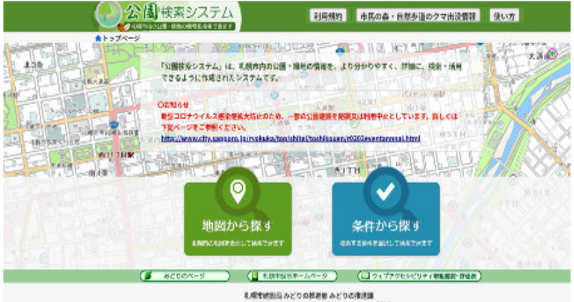
公園検索システム