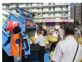
大人もゴミの投棄体験中