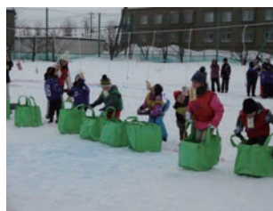
雪中運動会の1コマ