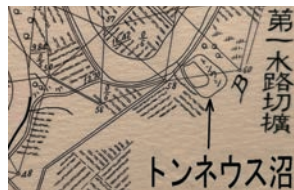
明治19年石狩川改修工事設計平面図