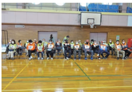
各町内会・連町からの参加者

参加した4年生児童の活発な動きで避難所開設もスムーズに行われ、意義深い防災訓練となりました。