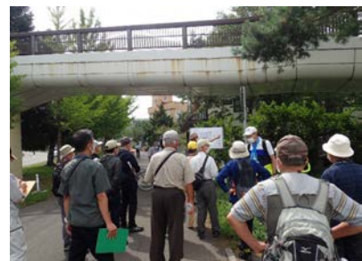
樹林見学ミニツアーの様子

去る9月3日(土)に今年度の伐採箇所の確認と今年度の伐採箇所について、樹木医の説明を受けながら、緑道を中心に見学をしました。