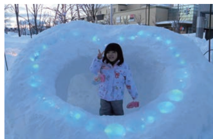
ハート形かまくらでハイポーズ!