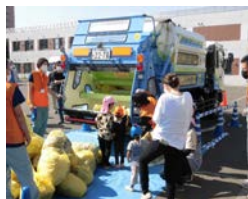
園児たちも体験中