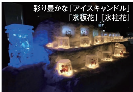
彩り豊かな「アイスキャンドル」「氷板花」「氷柱花」

昨年は新型コロナウイルス感染症拡大の影響で、やむなく中止となった「たくあいキャンドルナイト」ですが、今年はいよいよ輝きを増し、令和5年1月27日(金)から2月3日(金)、拓北・あいの里地区センター敷地内で開催されました。およそ200個のアイスキャンドルと、押し花が飾られた氷板花。また、これまでのキャンドルナイトにはなかった氷中花が、白とピンク、青のイルミネーションに彩られて輝き、地区センター利用者に癒しを与えました。また、ハート形かまくらでハイポーズ!