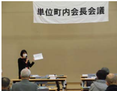
研修風景 (皆さん真剣です)

個人情報であるこの名簿の閲覧は、個人情報保護との関連を内容に含む同研修の受講者に限られるため、今後の展開に繋ぐ期待もあり、この機会に各町内会長に率先して受けていただきました。