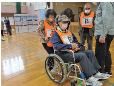
車椅子操作訓練の様子

ボールベットの組み立て・車椅子操作訓練・消火器訓練・避難所開設訓練などに積極的に取り組みました。