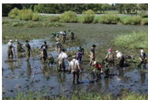
繁茂した湿生植物を除去する浚渫作業の様子

あいの里公園の中心にある周囲1キロメートルほどの沼です。この沼は明治19年の石狩川改修工事設計平面図(川の博物館)を見ると、石狩川の南側に「トンネウス」と書かれています。周辺は広葉樹林と荒地、湿地になっていきます。石狩川の氾濫等によってできた湿地帯であったことが分かります。この沼は雨水貯留地とし