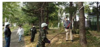
ボランティアの伐採作業中

途中休憩をはさみながら、ほぼ予定していた箇所の下枝は払えました。来年度は、西公園の南側を予定したいと思えます。