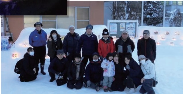
制作作業にご尽力された皆様 お疲れ様でした!