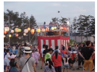
櫓を囲んで拓北盆まつり