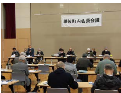
会議風景(寒い中お疲れ様でした！)

既に年度の半ばを経過しており、コロナで中止した行事もありましたが、現状と今後の方向性を確認する会議となりました。