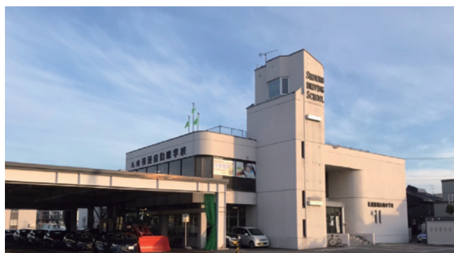
▲札幌篠路自動車学校

加害者、被害者両方が不幸になる交通事故。特に冬シーズンの今は、より慎重な運転を心がけましょう。