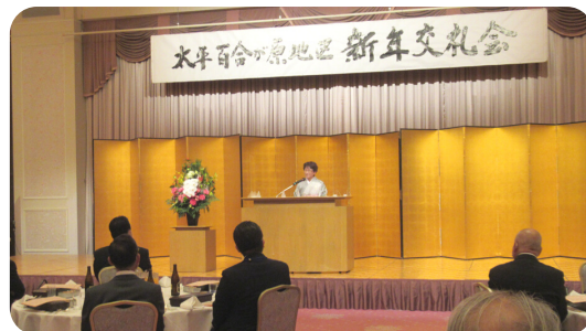
<連合町内会 庵跡会長より 新年のご挨拶>

結びに、本年が災害のない明るく平穏な年になり、また、皆様のますますのご健勝とご多幸を祈念し新年の挨拶といたします。