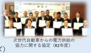
札幌市強靱化計画 (R元年改定)