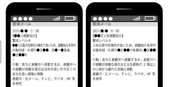
↑洪水時の例（町名表示）