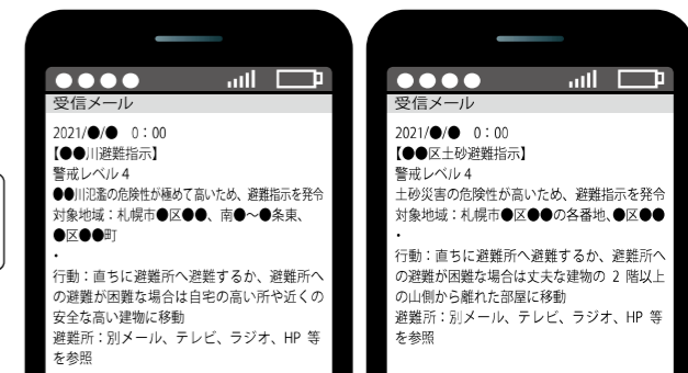
↑洪水時の例（町名表示）