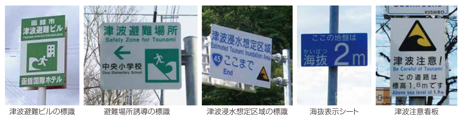
津波避難ビルの標識 避難場所誘導の標識 津波浸水想定区域の標識 海拔表示シート 津波注意看板

海の近くには、津波や避難に関する標識があります。旅行先の宿泊施設にハザードマップや避難ルート図が備えられているところもあります。大きな地震を感じたり、津波警報を見聞きしたら、これらの標識に注意して、冷静に行動しましょう。