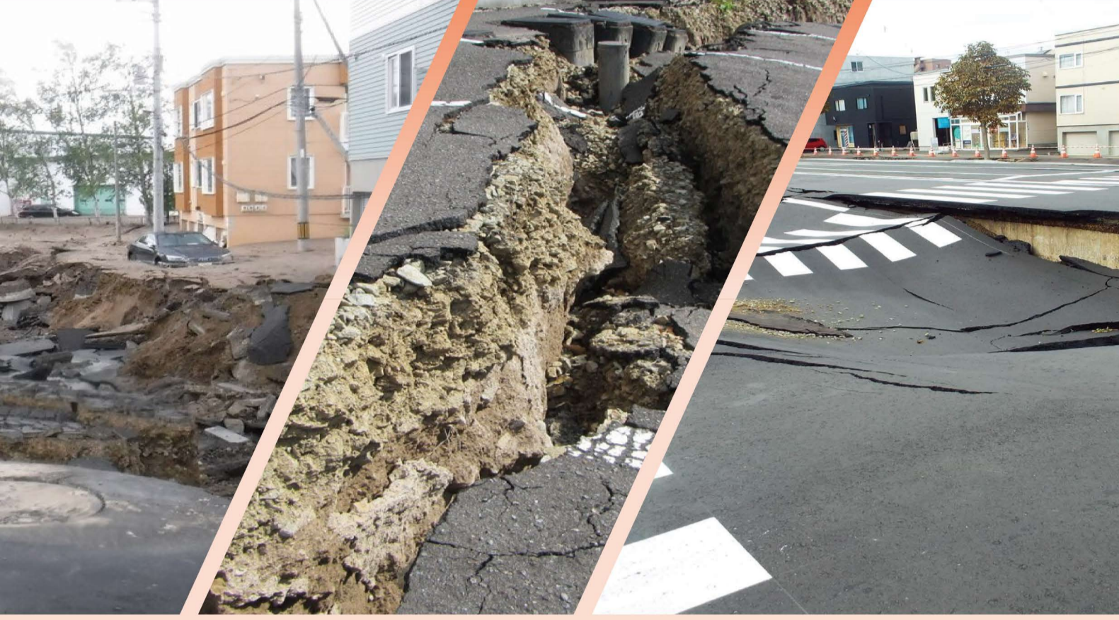
2018年北海道胆振東部地震

想定される地震による揺れを確認し、地震災害に対する日頃の備えや災害時の行動などを確認しましょう。