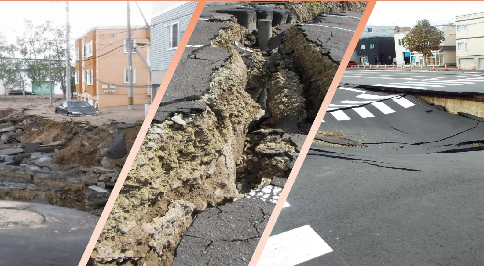
2018 年北海道胆振東部地震

想定される地震による揺れを確認し、地震災害に対する 日頃の備えや災害時の行動などを確認しましょう。