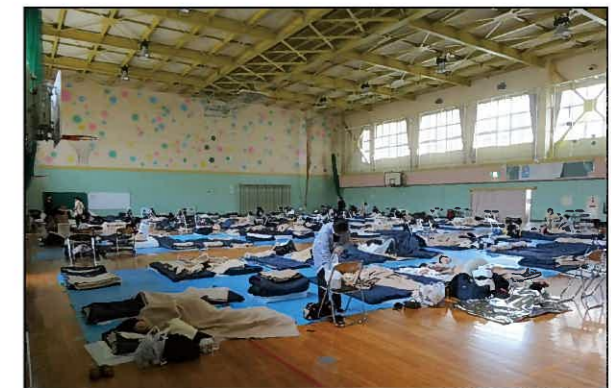
2018年北海道胆振東部地震