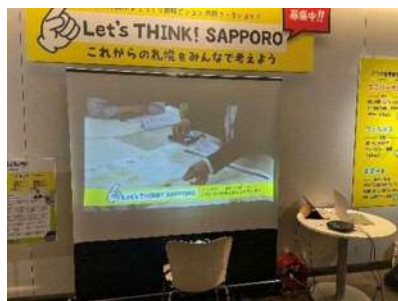
地下歩行空間内の人の流れに対して沿うように、第2次札幌市まちづくり戦略ビジョンの説明パネル、ワークショップの様子や意見を載せたパネルなどを設置。来場者がスムーズに戦略ビジョンについて理解を深めたいうで意見を引き出せるようにした。