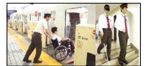
バリアフリー研修の様子