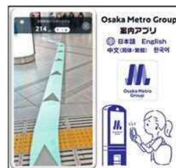
大阪メトロ・案内アプリの経路案内の事例