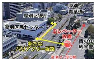
新さっぽろ駅のエレベーター設置によるバリアフリー経路の充実