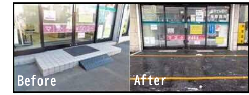
小規模店舗等のバリアフリー改修の事例（店舗入口の段差解消）