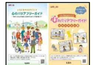
心のバリアフリーガイド