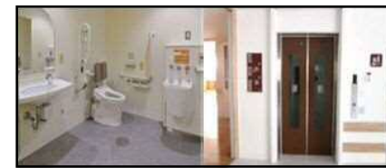
学校へのトイレやエレベーターの設置状況