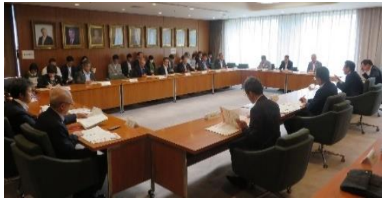
▲札幌市ユニバーサル推進本部

である「札幌市ユニバーサル推進本部」(令和5年9月設置)を当該推進体制として位置付ける予定です。