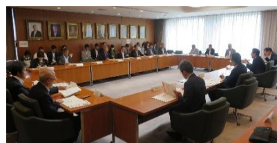
▲札幌市ユニバーサル推進本部

市は、共生社会の実現に向けた施策を総合的かつ計画的に企画し、調整し、及び実施するための推進体制を整備するものとする旨を規定しています。なお、令和5年9月に設置した市長を本部長とする「札幌市ユニバーサル推進本部」を、この規定の推進体制に位置付けています。