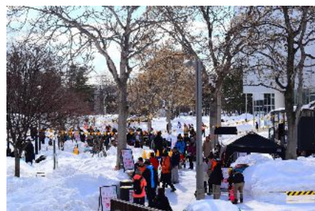
写真：冬季の屋外空間活用イベント