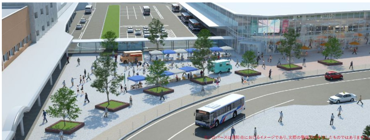
図：イメージパース（俯瞰）

具体的には、「人・公共交通主体」のまちづくりを実現するため、平岸通を迂回化し、駅、交流・交通広場、民間施設（商業等）を地上レベルでつなぐことにより、切れ目のない人の動線を構築します。また、にぎわいの核となる商業機能の導入、人々の滞留・交流を促す広場の整備、地域イベントの実施や観光案内等の情報発信などに取り組んでいきます。