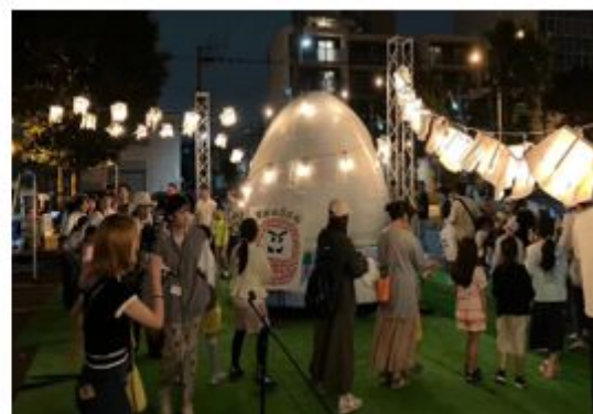
写真：ナイトマルシェと連動したイベント