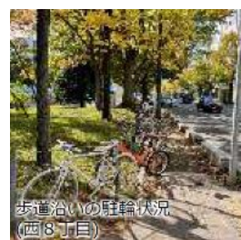
写真：大通公園の現在の様子

また、大通沿道の建物は更新時期が近付いているものが多く、今後、建替が進んでいくことが見込まれます。その際にはオープンスペースや道路空間の在り方なども考慮した、歩行者の為の空間づくりが必要になります。憩いやにぎわいの場としての道路空間の柔軟な利活用など、街区・道路・公園の一体感がある、居心地がよく「歩かざる」空間の形成に向けた検討を進めます。