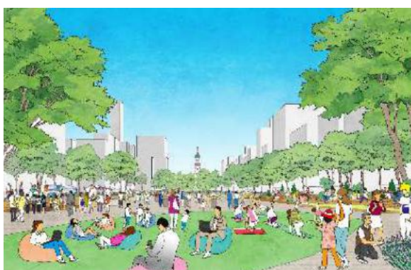
図：「大通公園のあり方」 2025年（令和7年）3月 札幌市策定

また、大通沿道の建物は更新時期が近付いているものが多く、今後、建替が進んでいくことが見込まれます。その際にはオープンスペースや道路空間の在り方なども考慮した、歩行者の為の空間づくりが必要になります。憩いやにぎわいの場としての道路空間の柔軟な利活用など、街区・道路・公園の一体感がある、居心地がよく「歩かざる」空間の形成に向けた検討を進めます。