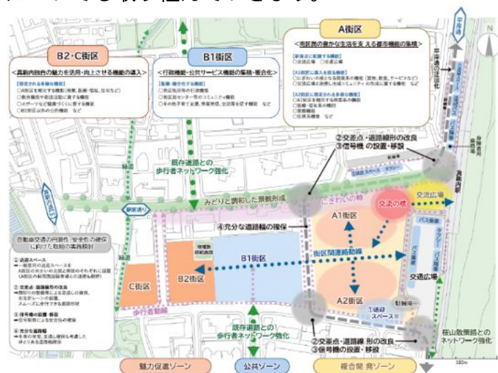
図：土地利用計画図

これらの真駒内駅前周辺地区のまちづくり及び各関係機関と連携した継続的なまちの再生を通じて、真駒内地域の住宅地の魅力を高めるとともに、歩行者の回遊性向上についても取り組んでいきます。