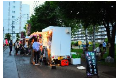
写真：実証実験時（キッチンカー等）