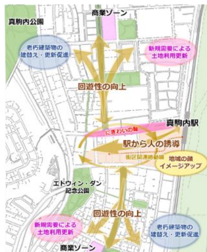
図：連鎖的な土地利用転換のイメージ