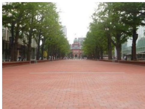
写真：整備後の広場空間

北3条広場の魅力的なパブリックスペース活用において、指定管理者である「札幌駅前通まちづくり株式会社」が重要な役割を担っています。同社は、札幌駅前通地下歩行空間（広場）の管理も手掛ける全国的にも著名なエリアマネジメント団体です。単なる施設の管理に留まらず、「いかに地域の価値を向上させるか」という視点に基づいた企画・運営を行っています。