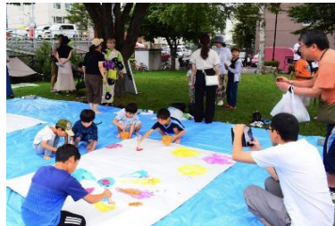
写真：実証実験時（子ども向け企画）

平岸マルシェは、住宅街において「歩かざる空間」を創出した好事例であり、「Well-Moving City SAPPORO」の理念を体現しています。特に生活道路と街区公園を一体的に活用することで、歩行者数や会話・飲食などのアクティビティが顕著に増加し「歩くことの価値」を市民自身が実感できる場となりました。加えて、学生主体のワークショップや運営により、地域の若手人材の育成と地域参加の新しい形も提示しています。他地域への展開には、すでに存在する空間の再評価、地域住民との信頼構築、行政の柔軟な制度運用が鍵となります。平岸での成果は住宅市街地におけるパブリックスペース活用の実証的なモデルケースであり他地域への波及が期待されます。