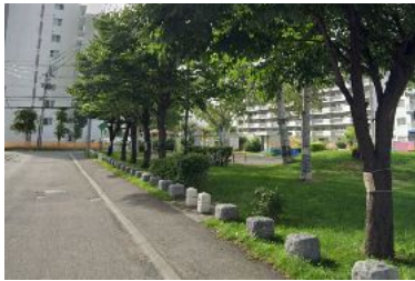
写真：平時の道路空間

特に令和6年夏には、地下鉄平岸駅から約400mの生活道路および「風の子公園」を活用した「ナイトマルシェ」の実証実験が実施されました。キッチンカーや休憩スペースの設置、盆踊りなどのイベントを通じて、歩行者数は平時と比較して約6倍、滞在時間は約23倍に増加。従来の“通過する空間”が“滞留・交流する空間”へと大きく変容しました。地域の企業、大学、商店街、行政が連携し、月2回開催を数年継続する中で、文化として定着しつつあります。