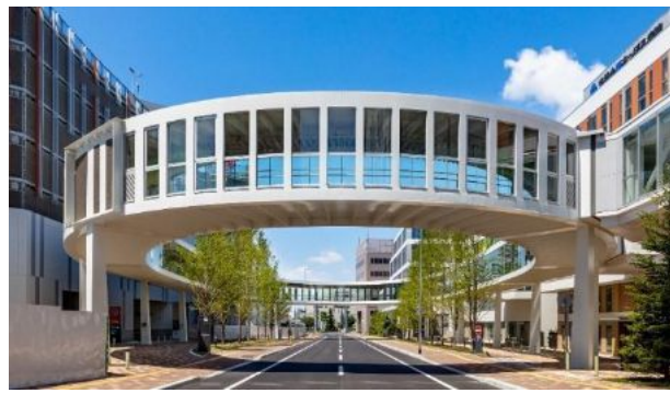
写真：周辺施設をつなぐアクティブリンク

「一般社団法人新さっぽろエリアマネジメント」の取組の一つである「新さっぽろやってみたい展」は、新さっぽろ駅周辺で生活する方々はどんなことを考えているのかを知るため、あらゆる年代・職業の方の「やってみたい」の声をご本人の写真とコメントでアクティブリンクの壁面に掲示したものです。