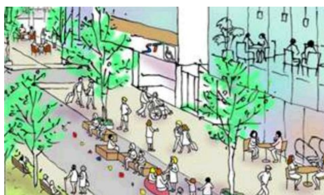
図：「大通及びその周辺のまちづくり方針」 2023年（令和5年）10月 札幌市策定