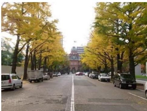
写真：整備前の車道空間

旧北海道庁赤れんが庁舎前に広がる「北3条広場（愛称：アカプラ）」は、2014年（平成26年）に供用を開始した、官民連携による都市再生の象徴的事例です。元は車道として使用されていたこの空間は、隣接地の再開発における公共貢献により、延長約100m、面積約2,800㎡のパブリックスペースとして整備されました。周辺には、多くのオフィスが立地し、平日はオフィスワーカーの憩いの場、休日にはイベントが開催されるにぎわいの拠点として定着しています。音楽ライブや季節ごとの催事、冬季のスケートリンクなど、年間を通して多彩な使い方がされており、近年では3×3バスケットボールコートイベント設置など、活用の用途が進化し続けています。都市の中心部における人中心の空間づくりとして、市民と来訪者の双方から高い支持を得ている好事例です。