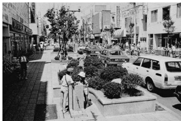
写真：ショッピングモール事業

そうしたなか、令和2年の道路法改正により「歩行者利便増進道路（通称：ほこみち）制度」が創設されました。これは、快適な生活環境の確保と地域活性化に資する場合には道路占用許可の基準が緩和され、歩道上にベンチやテーブル等が設置しやすくなる制度で、道路を移動空間としてだけでなく、そこに滞在し、楽しみ、交流するための空間として構築することができます。