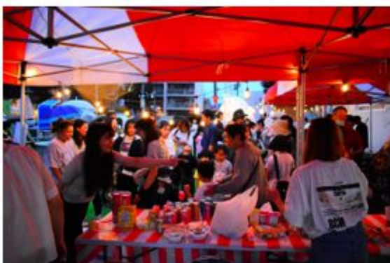
写真：学生主体のマルシェ運営

平岸マルシェは、住宅街において「歩かざる空間」を創出した好事例であり、「Well-Moving City SAPPORO」の理念を体現しています。特に生活道路と街区公園を一体的に活用することで、歩行者数や会話・飲食などのアクティビティが顕著に増加し「歩くことの価値」を市民自身が実感できる場となりました。加えて、学生主体のワークショップや運営により、地域の若手人材の育成と地域参加の新しい形も提示しています。他地域への展開には、すでに存在する空間の再評価、地域住民との信頼構築、行政の柔軟な制度運用が鍵となります。平岸での成果は住宅市街地におけるパブリックスペース活用の実証的なモデルケースであり他地域への波及が期待されます。