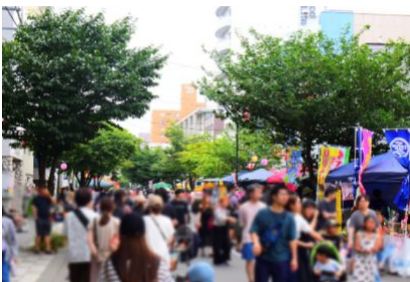
写真：萬蔵祭における道路空間活用

本市では、本郷商店街が所在する市道本郷中央線において、市内第一号となる「ほこみち」の指定を目指し、商店街を中心とした地域コミュニティの自主性を尊重した道路空間の利活用を支援します。これにより、既存の商店街の概念に留まらないエリア全体の魅力向上を図り、地域内外から人々が自然と集まり、立ち寄り、憩える。歩かざるまちづくりを推進します。