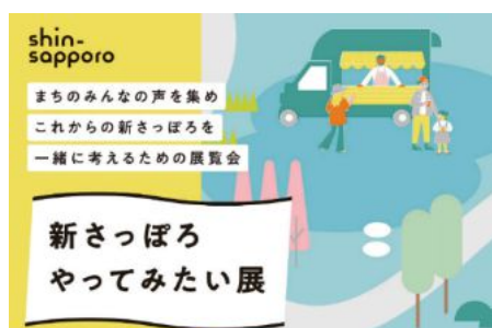
写真：新さっぽろやってみたい展

また、冬季における屋外空間の活用は、札幌の気候特性を生かした取組として注目され、令和6年度の冬に実施した実証イベントでは一日で約4,000名以上もの来場者が訪れました。本取組は、他地域への展開可能性を示す一つのモデルケースとして、今後も札幌市の拠点のまちづくりを牽引する存在として注目されています。