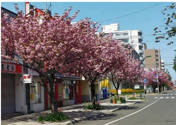
写真：本郷商店街の桜並木

この道路空間は、人々のにぎわいや交流の場としての活用を目指して整備されましたが、商店街や地域からの要望がありながらも一般的な道路としての利用に留まり、その特徴を十分生かせずにいるのが現状です。