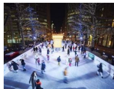
写真：近年の多彩な空間活用事例