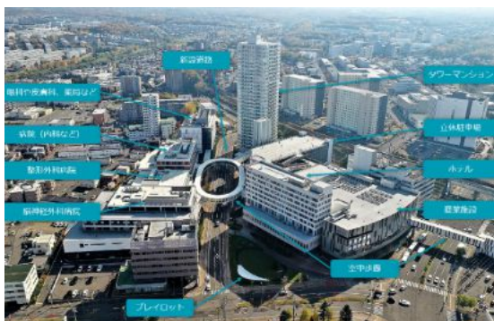
写真：整備後の新さっぽろ駅周辺（I街区）

新さっぽろ駅周辺は、地下鉄東西線とJR千歳線が交差する交通結節点であり、厚別区の中心的な地域です。平成26年度に策定された「新さっぽろ駅周辺地区まちづくり計画」に基づき、商業・医療・教育機能等の集積による複合的な土地利用と、歩行者ネットワークの形成により、駅と周辺施設との回遊性が向上し、誰もが快適に移動できる環境が整備されました。科学館公園や市民交流広場などのパブリックスペースにおいても、積極的な利活用により地域のにぎわい創出に寄与しています。