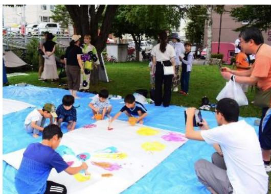
写真：公園を活用した子ども向けイベント

そこで札幌市では新たに「パブリックスペース活用ガイドライン」を策定します。道路や公園、広場や公開空地等において、必要な手続きや申請フローを整理し、さらに簡素化できるものは手続きそのものを減らしていくことや、活用要件の緩和などを検討し、活用者目線に立った取組を推進していきます。