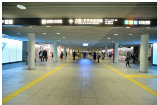
写真:地下歩行空間のハード整備