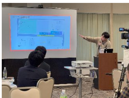
写真:実証実験成果報告会

また平岸マルシェ(北海学園大学)や八百カフェ(札幌市立大学)などでは、学生が主体となって地域と協働しており、都市に根ざした学びと貢献が展開されています。高校生においても、札幌市教育委員会が実施する「まなびまくり社」のような探究学習が進められ、若年層が地域に関心を持ち、まちづくりの一翼を担う動きが芽生えています。