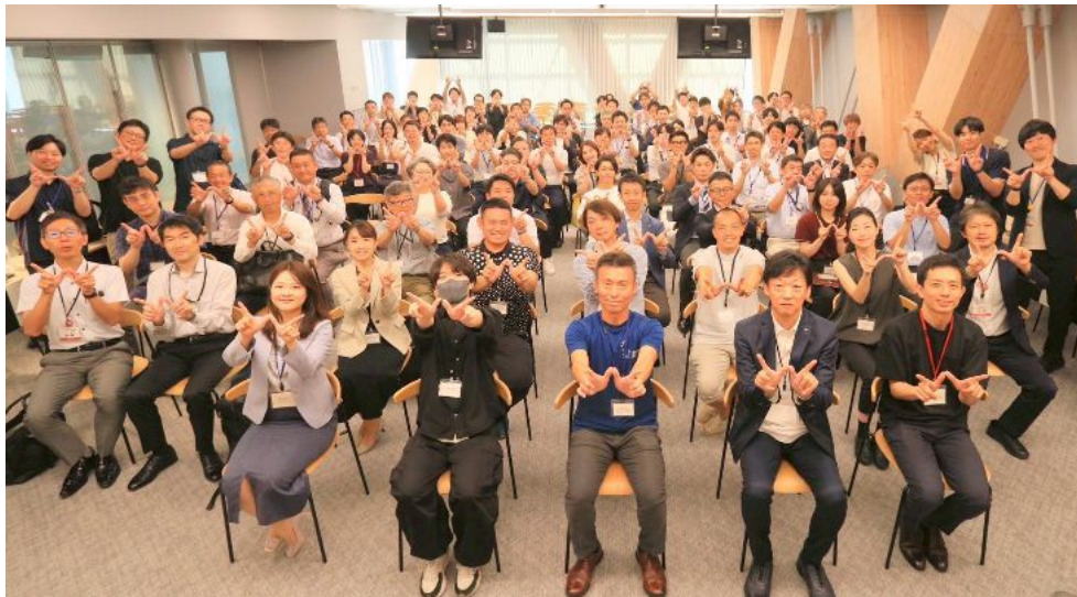
写真: サッポロオーカブルシンポジウム2025

2025年(令和7年)7月に開催された「サッポロオーカブルシンポジウム2025」は、市内各地のまちづくり団体が一堂に会する貴重な機会となりました。このシンポジウムでは、各団体の活動内容の共有や、課題解決に向けた討議が効果的であったとの評価が多く寄せられています。今後も、一般市民を含め、広く札幌市のまちづくりを共有する機会を設けることを検討していきます。