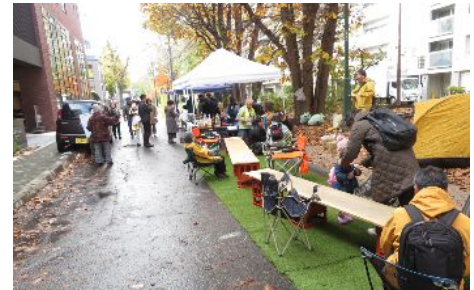
写真：ミニ大通誕生祭

さらに、地域住民が主体的に活動する以外にも「Well-Moving City SAPPORO」の推進においては、一参加者として地域イベントや町内会活動に参加すること、あるいは移動手段として自家用車ではなく公共交通機関を選択することも、重要な役割を果たすことになります。