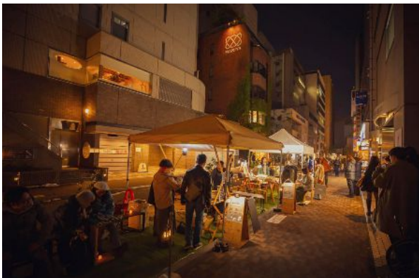
写真:時計台前仲通り社会実験の様子

本スクールは2024年に開講しこれまで2度開催され、札幌時計台の前にある小さな仲通り(通称:時計台前仲通り)を対象として社会実験を行ってきました。受講生が得たものは単なる知識ではなく都市空間と向き合う実践力です。札幌都心で社会実験を企画・実施し、地域関係者や住民と対話を重ねる中で、パブリックスペースの意味やデザインの価値を再発見しました。この過程を通じて、パブリックスペース活用の企画力、協議・合意形成のスキル、そして現場での対応力が磨かれます。こうした人材は、「Well-Moving City SAPPORO 2045 ビジョン」において、パブリックスペースを本当の意味で居心地の良い公共的空間にしていく上で強力な推進力となります。デザイン思考と現場対応力を備えた人材が増えることは、札幌のまち全体の創造力と共創力を高めることに寄与し、今後もスクールの更なる継続・発展が期待されます。