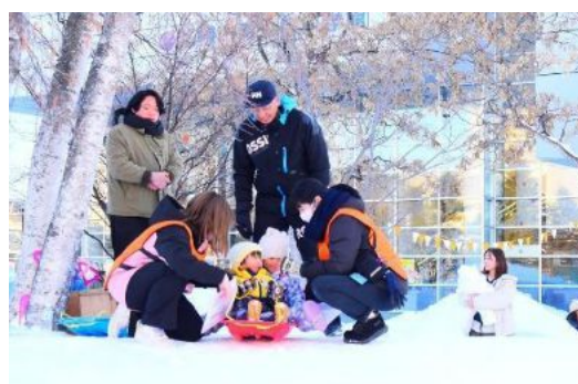
写真:新さっぽろワクワク冬の実験フェスタ