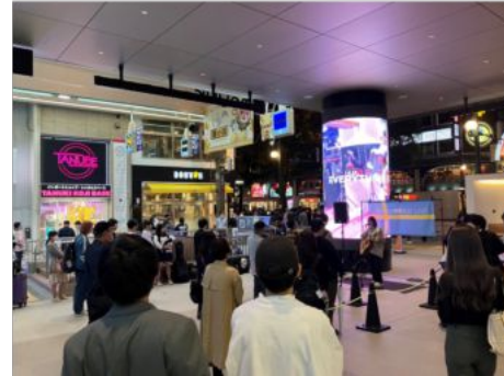
写真:公開空地(モユクサッポロ)