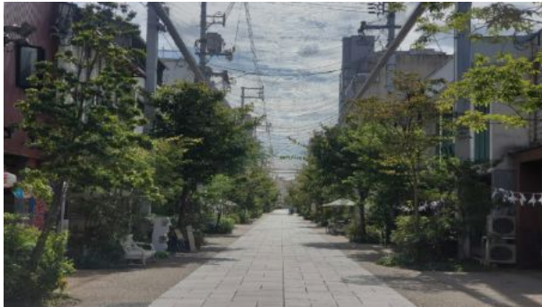
写真:福山本通商店街(広島県福山市) ※令和3年9月ほこみち指定

今後は、新たに「歩行者利便増進道路(通称:ほこみち)」制度などを活用し、地域の創意工夫を反映した空間整備・活用を推進します。さらに、冬季のスノーキャンドル設置などの季節イベントへの支援、再開発時の公共貢献に対する多様なインセンティブの付与、緩和型の土地利用計画制度の運用による良好な民間都市開発の誘導など、多角的な支援環境を構築していきます。