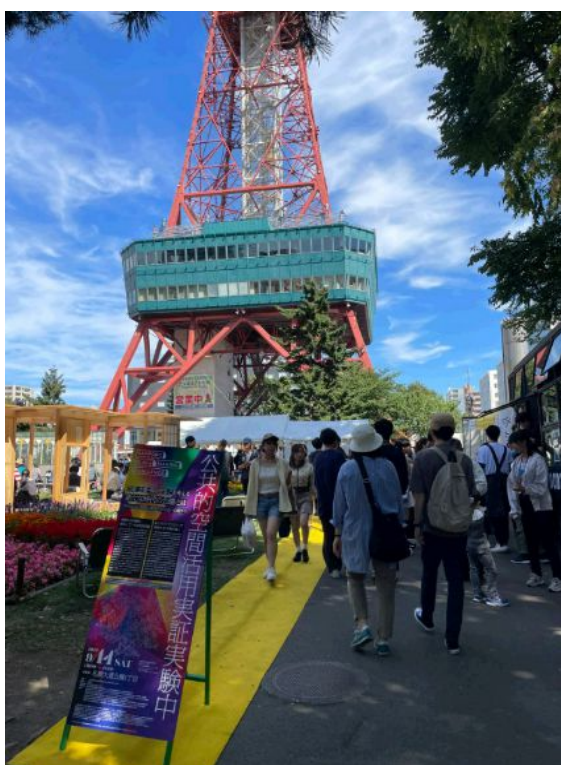
写真:公共的空間活用実証実験 ※札幌市立高校 探究学習協力事業

さらに1人ひとりの人材育成だけでなく、札幌市内各地で活動が活発化し始めているエリアマネジメント団体について、その重要性を十分に認識した上で、持続可能な支援の在り方を検討していきます。