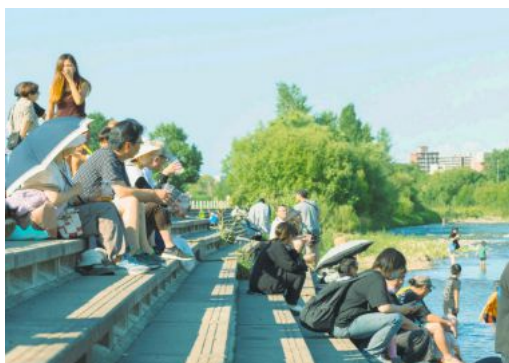
写真:「川見」を楽しむ人々

豊平川の河川敷を活用して毎年8月に2週間程度実施される「川見」イベントでは、札幌の短い夏を自然とともに楽しみ、河川に安全に触れる機会を提供することで、2025年(令和7年)実績では約5万人以上の来場があり、札幌の夏の文化として定着し始めています。