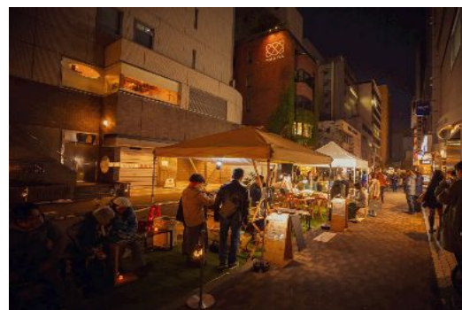
写真:時計台前仲通り実証実験 ※ストリートデザインスクール2024