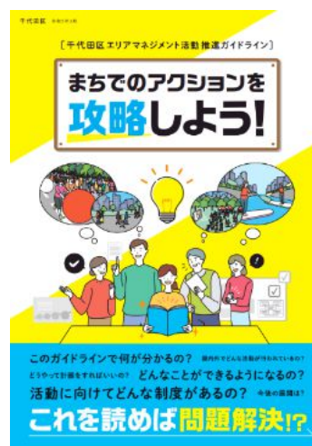
図：千代田区ガイドライン事例