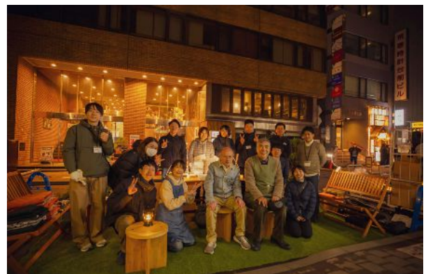
写真:地域関係者と受講生の集合写真