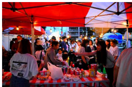
写真:平岸マルシェ