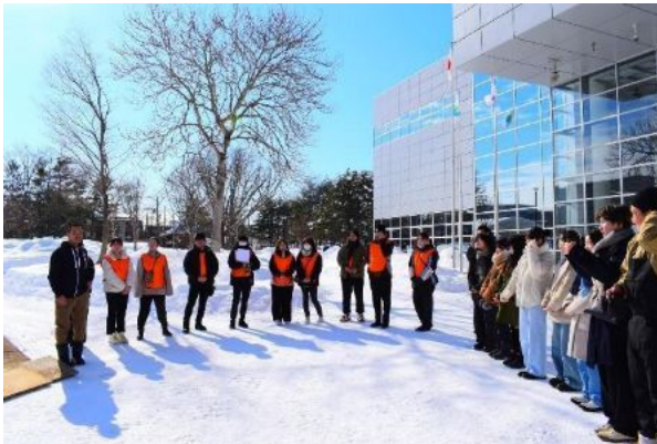
写真：産官学民が一体となって取り組んだ 「新さっぽろワクワク冬の実験フェスタ」の朝礼風景

前述の「Well-Moving Network」の活動内容とは別に、本ビジョンにおける 産学官民の一般的な役割分担を以下に明記します。この多様な主体による幅広い活動と、「Well-Moving Network」との連携により、まちづくりにおいて、活動の裾野の広さと、取り組みの深さの両立を目指します。