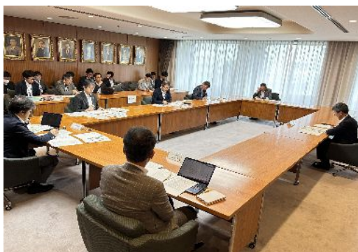
写真:札幌市ウォークブル推進本部会議

また、前述した「Well-Moving Network」を支援し、市民や企業の創意工夫を引き出すため、積極的にデータセットを提供し、オープンデータの利活用を促進します。さらに、これまで都心部が中心であったパブリックスペース活用施策を、地域交流拠点にも戦略的に展開し、地域特性に応じた取り組みを推進します。これに加え、次項で示す「支援制度の構築・運用」を着実に進めることで、民間主体の活動を後押しする役割を果たします。