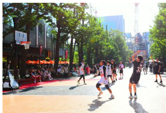
写真:北3条広場(アカプラ)の民間活用