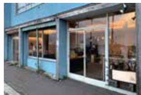
KIM GLASS DESIGN 外観

るきっかけでした。その後19歳で修行の道に入り、26歳で独立。KIM GLASS DESIGNをスタートさせました。さつぽろ圏の魅力はやはり、大都市札幌があり、たくさんの仕事のチャンスがありながら、そこから1〜2時間前後で、最高の自然が味わえるバランスの良さだと思います。この経済と自然の融合は、私のような作り手にとって間違いなくアドバンテージです。