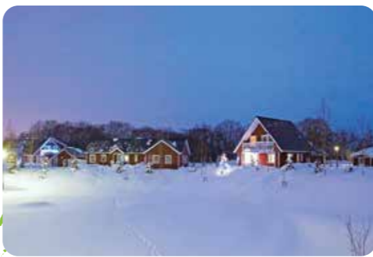
スウェーデンヒルズ