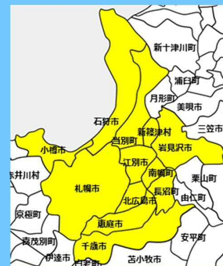
圏域図（計画策定予定範囲）