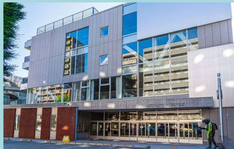
公立夜間中学として活用される予定の資生館小学校（札幌市中央区）の校舎