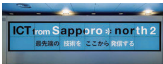
横型60インチ12枚・マルチディスプレイ1面

※商業広告が目的のご利用は禁止とするなど、サービスには基準を定めております。詳しくはホームページをご参照、またはお問い合わせください。