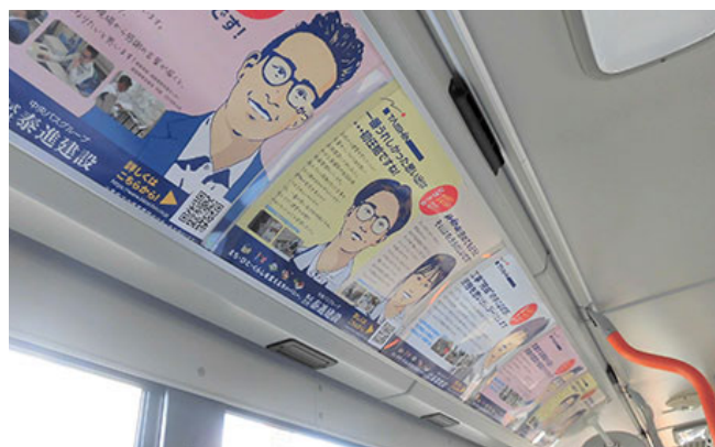
北海道中央バス車内「ポスター」

通勤・通学・ショッピングなど毎日たくさんの人が利用します。ポスター・ステッカー・ラッピングバスなどの広告を掲示することにより効果的なPRが出来ます。