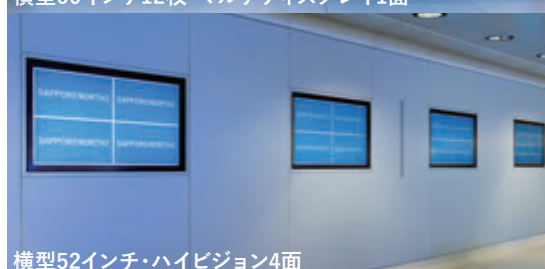
横型52インチ・ハイビジョン4面