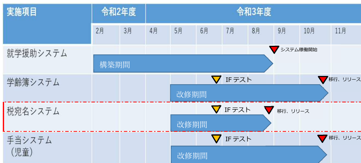
図2 本業務のスケジュール（赤枠は対象システム）

また、詳細なリリース時期については別途調整することとするが、就学援助システムとリリース日が異なる場合、運用回避方法の検討および作業については本業務では対象外とする。