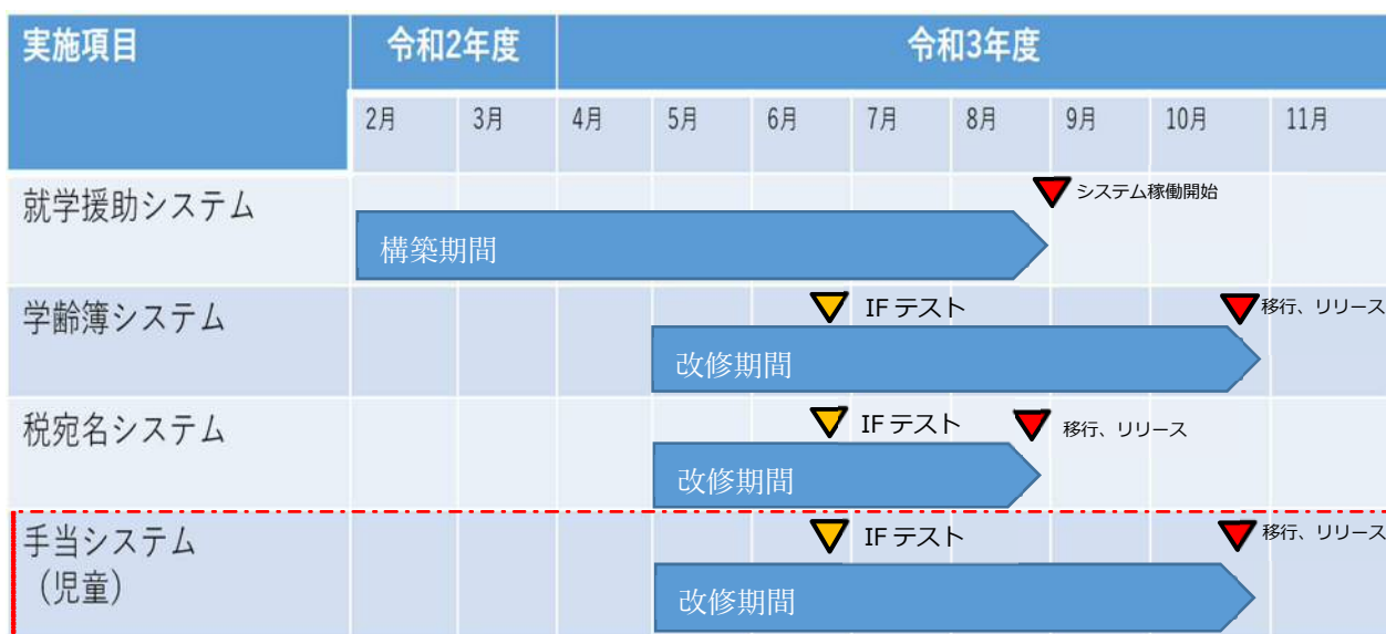
図2 本業務のスケジュール（赤枠は対象システム）