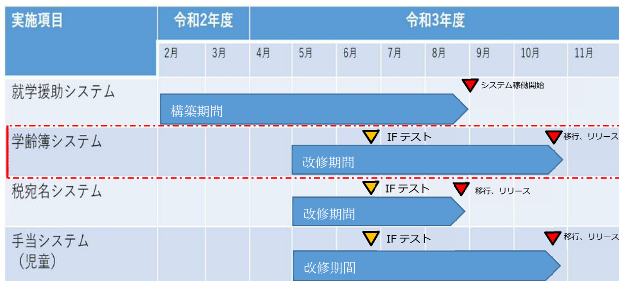
図2 本業務のスケジュール（赤枠は対象システム）