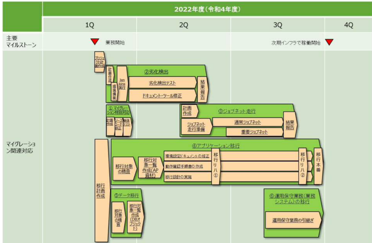
図1 本業務のスケジュール