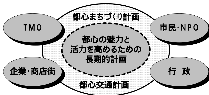
市民と協働によるプロジェクト展開

このため、都心の魅力を楽しむ公共空間の活用、再生に向け、道路空間をうまく使うための仕組みづくりに交通面から取り組んでいくことにより、市民が都心を訪れ、仕事をし、買い物をするだけではなく、主体的ににぎわいづくりに参加し、そこで生まれる文化を育ていけるような魅力ある都心空間の創出を目指す必要があります。