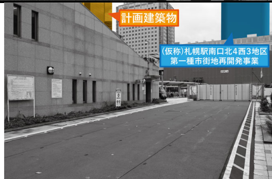
建設後写真8.1.12-2(2) 地点 2：札幌駅北口交番からの景観の変化(落葉季)

注) 準備書時点における計画であり、今後の設計及び関係機関等との協議等により、変更となる可能性がある。