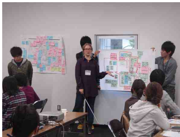
グループ毎に大切にすべきテーマについて発表