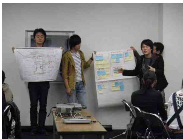
まち歩きの結果発表