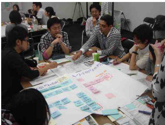
将来大切にすべきテーマについて議論