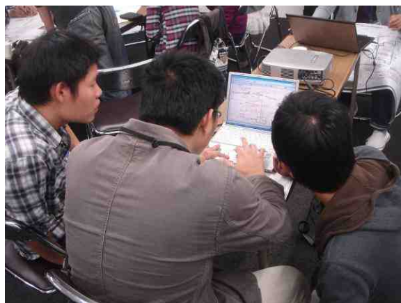
学生自身によるプレゼン資料の作成