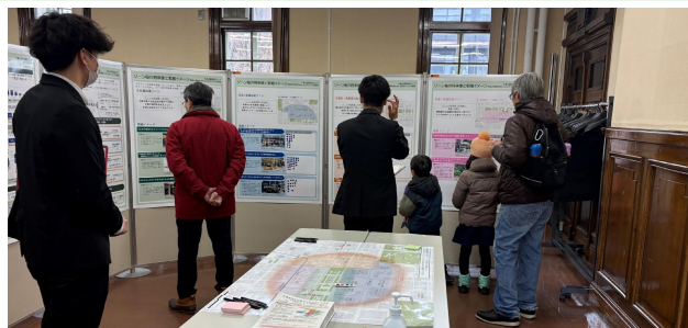
当日の様子 (札幌市資料館 研修室)