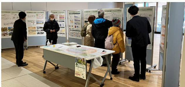
当日の様子 (中央区複合庁舎 区民ギャラリー)

●お問い合わせ先 札幌市まちづくり政策局都心まちづくり推進室 TEL:011-211-2692