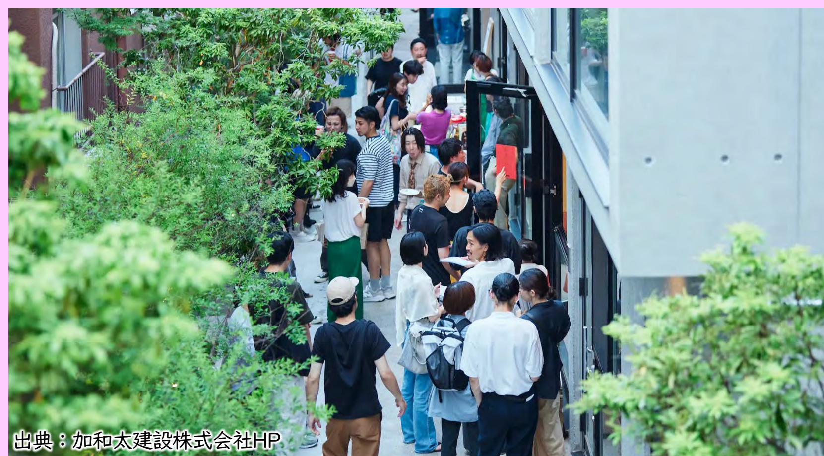
1階に建物内外の人々の交流の拠点となるような飲食店・ショップを設けたオフィスとレジデンスの複合施設 (東京都・CABO uehara)