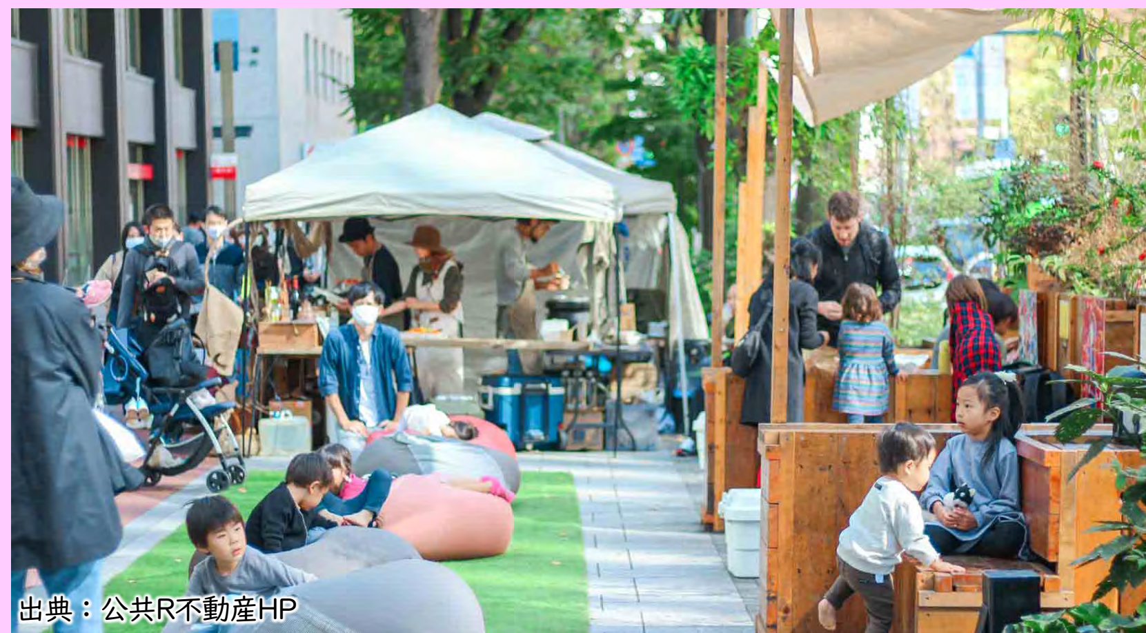
人の往来が少なかった通りが、人々の居心地や使い方の可能性を引き出すパブリックスペースへアップデート。 (東京都・IKEBUKURO LIVING LOOP)