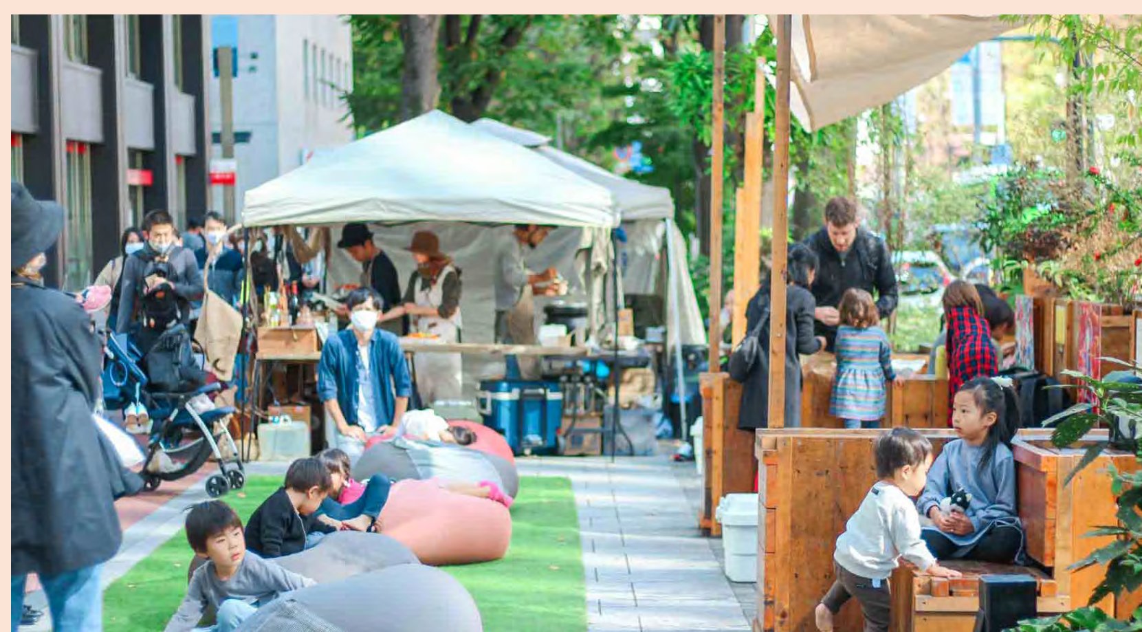
人の往来が少なかった通りが、人々の居心地や使い方の可能性を引き出すパブリックスペースへアップデート。（東京都・IKEBUKURO LIVING LOOP）