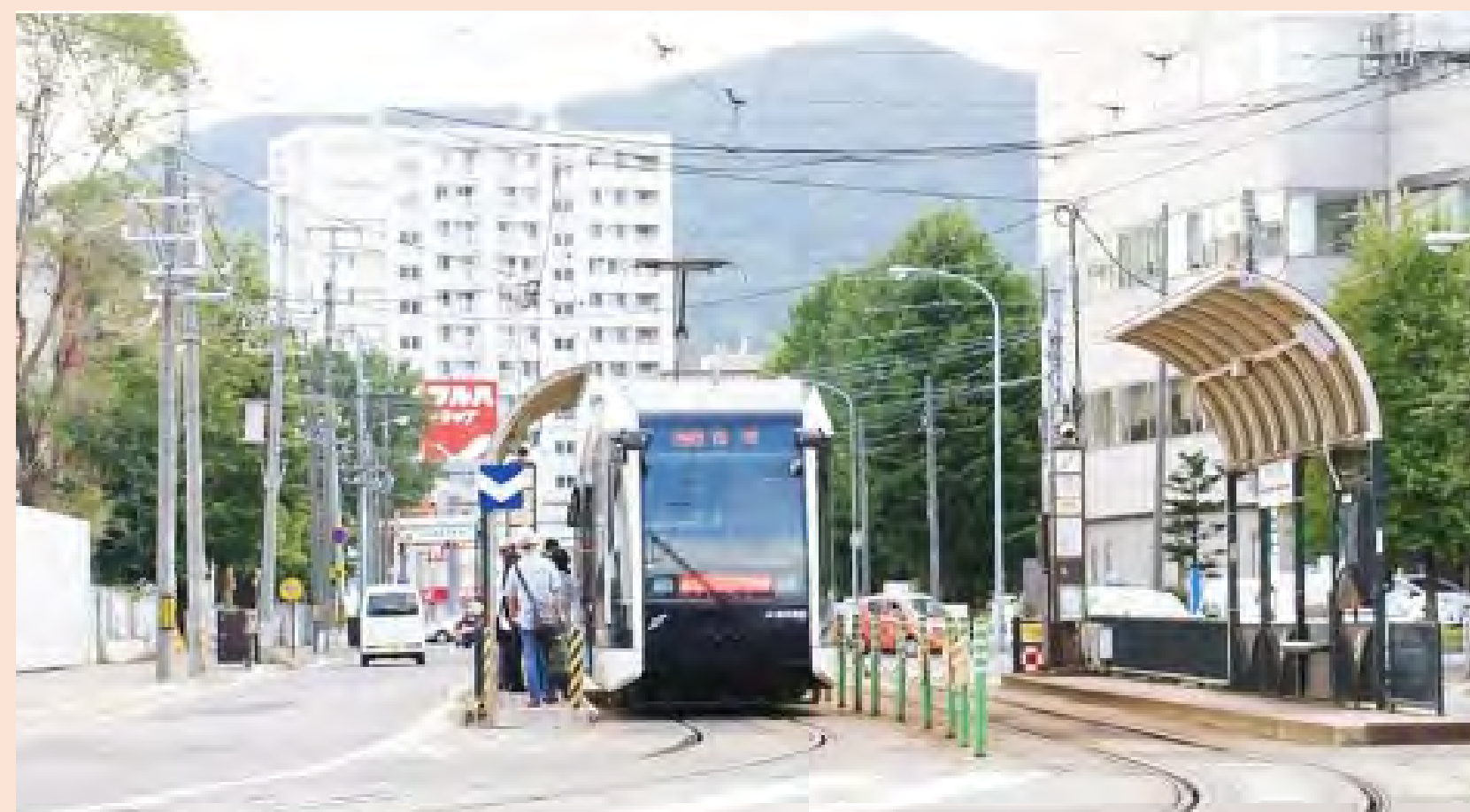
路面電車と電停（西15丁目駅）