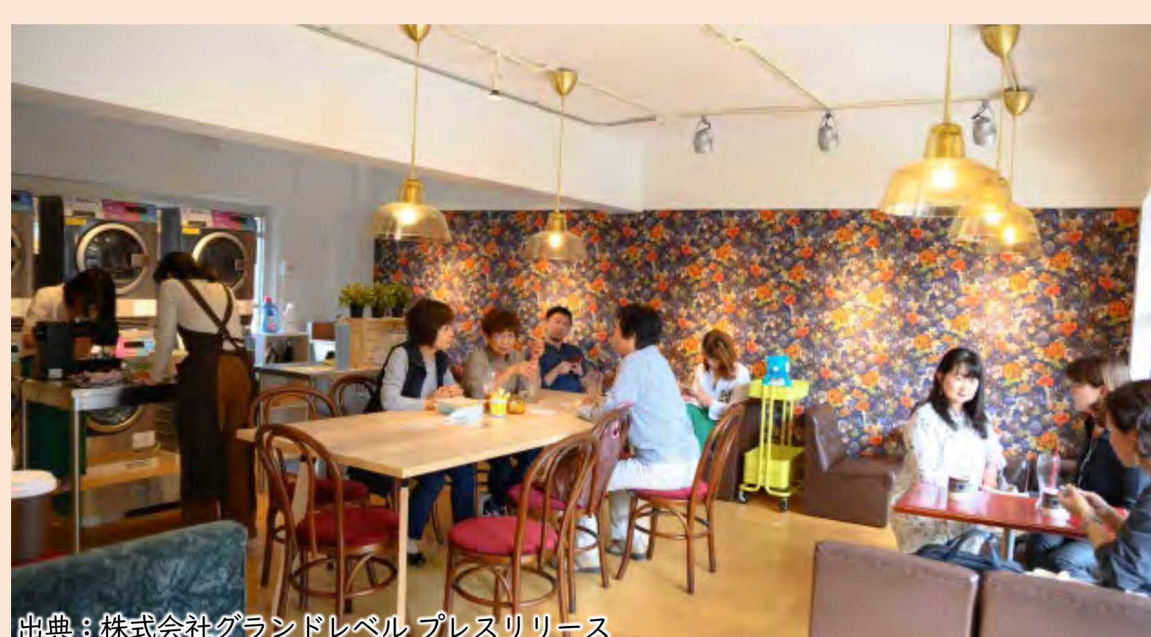
駅前の団地の1階に整備されたランドリー付き地元コミュニティ型喫茶店（神奈川県・喫茶ランドリーホシノタニ団地）