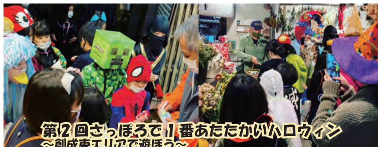
第2回さっぽろで1番あたたかいハロウィン ～創成東エリアで遊ぼう～

コロナ禍にあって、祭事、イベント等が実施できない状況ではありましたが、地区関係団体が地区の皆様の想いに応え、感染予防に十分配慮しながら、創意工夫を凝らした活動を行いました。