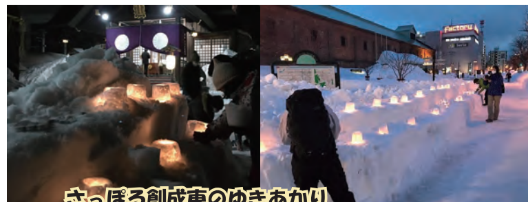
さっぽろ創成東のゆきあかり

実施概要；創成東地区内の25の店舗・施設の協力で、200人以上の子どもたちがまちなかを歩き、ハロウィンを楽しみました。子どもたちは初めての地域の人、お店に声を掛け、お店のみなさんは「また来てね！」「いってらっしゃい」と見送る、タイトルの通りの『あたたかいハロウィン』イベントとなりました。