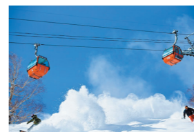
札幌国際スキー場