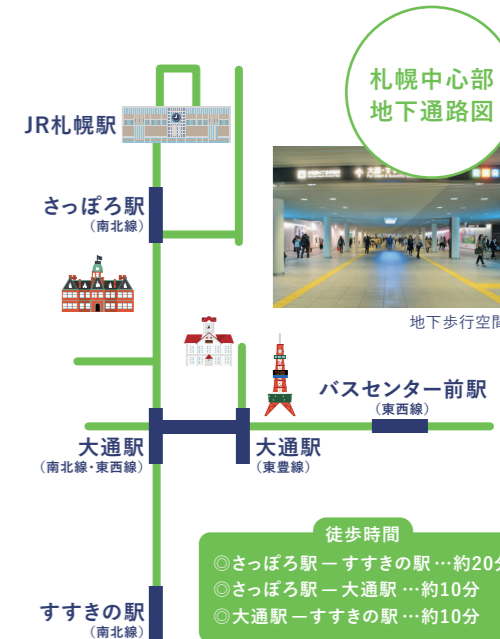
札幌中心部 地下通路図

徒歩時間 ◎さっぽろ駅—すすきの駅…約20分 ◎さっぽろ駅—大通駅…約10分 ◎大通駅—すすきの駅…約10分