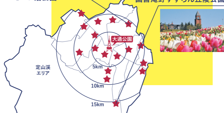
国営滝野すずらん丘陵公園

北海道らしい動植物に出会える「国営滝野すずらん丘陵公園」や彫刻家イサム・ノグチにより基本設計が策定された「モエレ沼公園」など、さまざまな個性を持った大規模な公園が市内各エリア17箇所にあります。