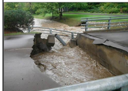
増水による 橋梁被害(滝野)

2014年9月11日の豪雨では、 床上浸水7件、道路冠水98件、 土砂崩れ9件など、大きな被害がありました。