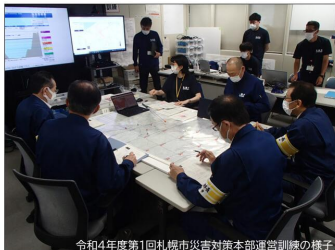
令和4年度第1回札幌市災害対策本部運営訓練の様子

市公式ホームページやSNS、 さっぽろ防災ポータル、防災アプリなど さまざまな手段で情報を発信します。