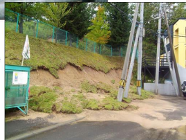
法面の崩壊 (真駒内)