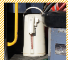
ホースの連結部の氷を融かすためのお湯を消防車内に常備