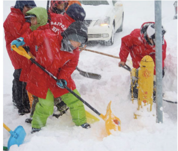
地域の消火栓を除雪する川沿少年消防クラブのクラブ員

これは暖かい地域には決してない、北国ならではの市と地域のあたたかなつながりです。しかし、少子高齢化や人口減少が加速するこれからの時代はこういったことを続けていくことが難しいと考えられます。今こそ、消火栓の除雪を通じて地域の結び付きを強くし、みんなで安全なまちをつくっていきませんか？