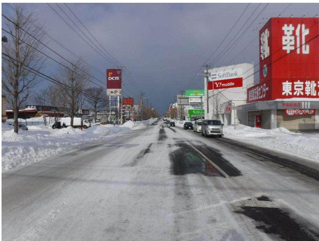
【幹線道路】 下手稲通（前田）