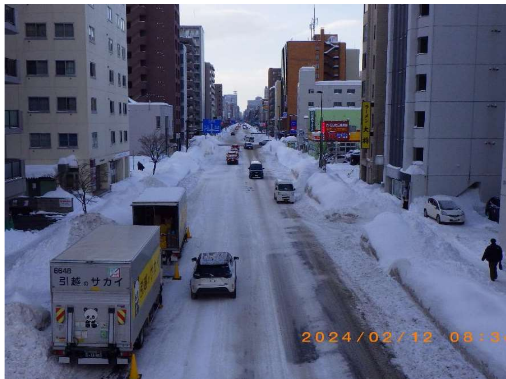
【幹線道路】西5丁目・樽川通