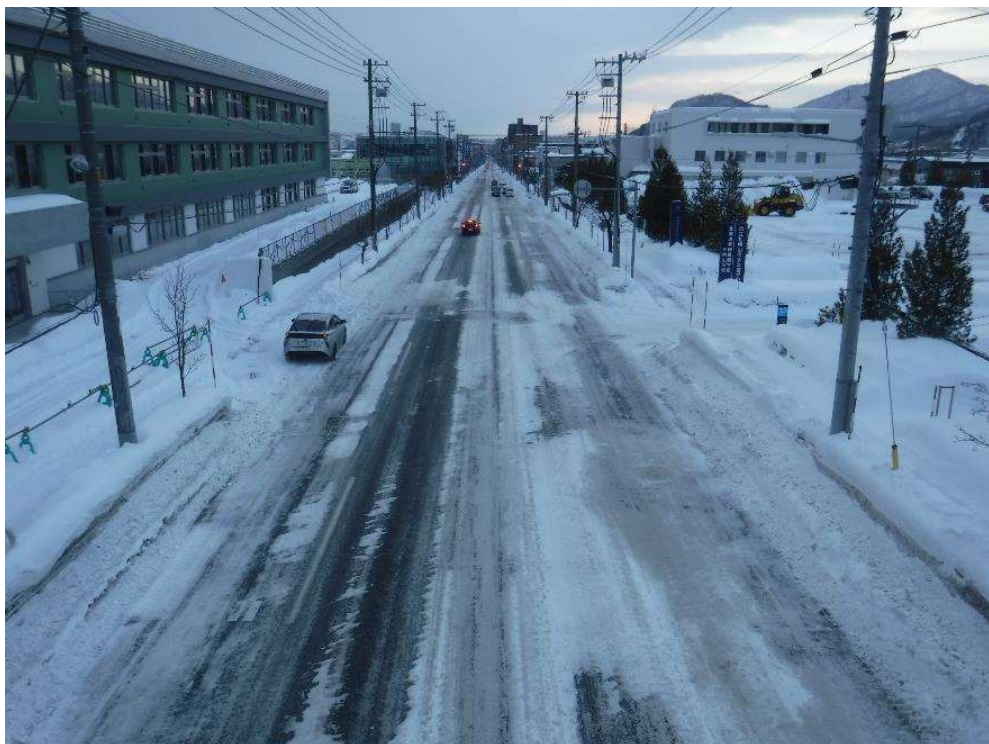
【幹線道路】 山の手通（山の手小学校前）