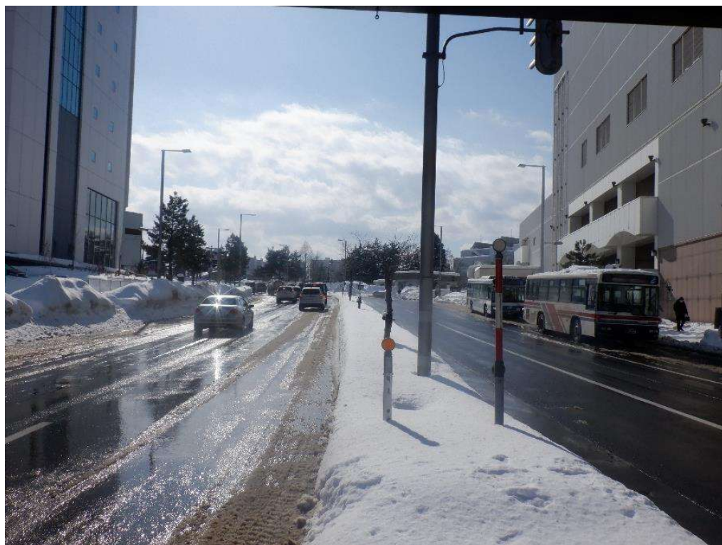
【幹線道路】 厚別青葉通（厚別中央）