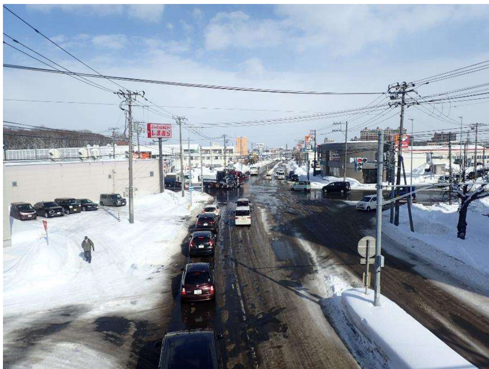
【幹線道路】 厚別滝野公園通(清田)