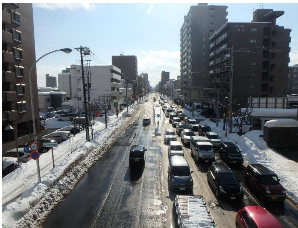
【幹線道路】 東15丁目・屯田通