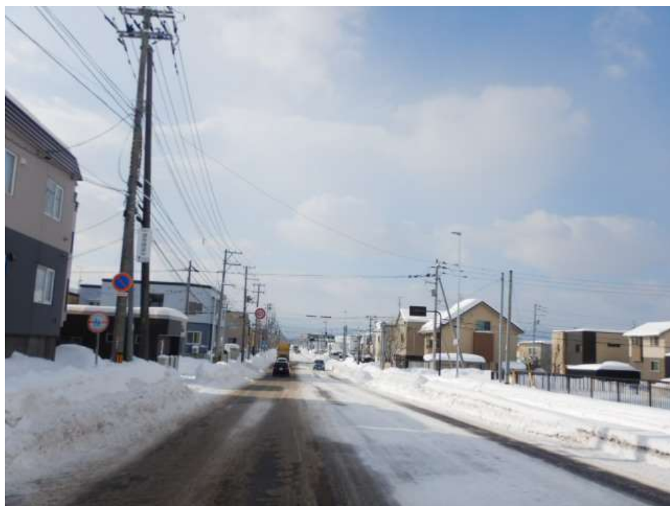
【幹線道路】 三角点通（東苗穂15条）