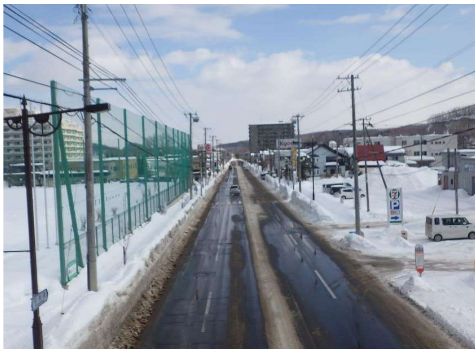
【幹線道路】 川沿石山連絡線(石山)